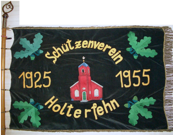
Fahne von 1955