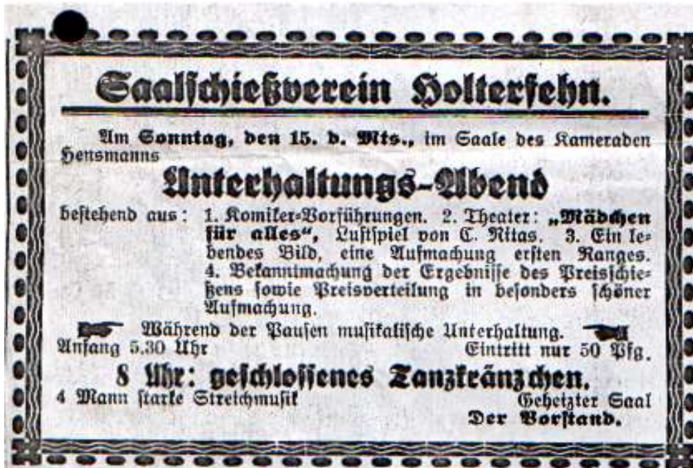
Zeitungsanzeige aus dem General Anzeiger vom 13.11.1925