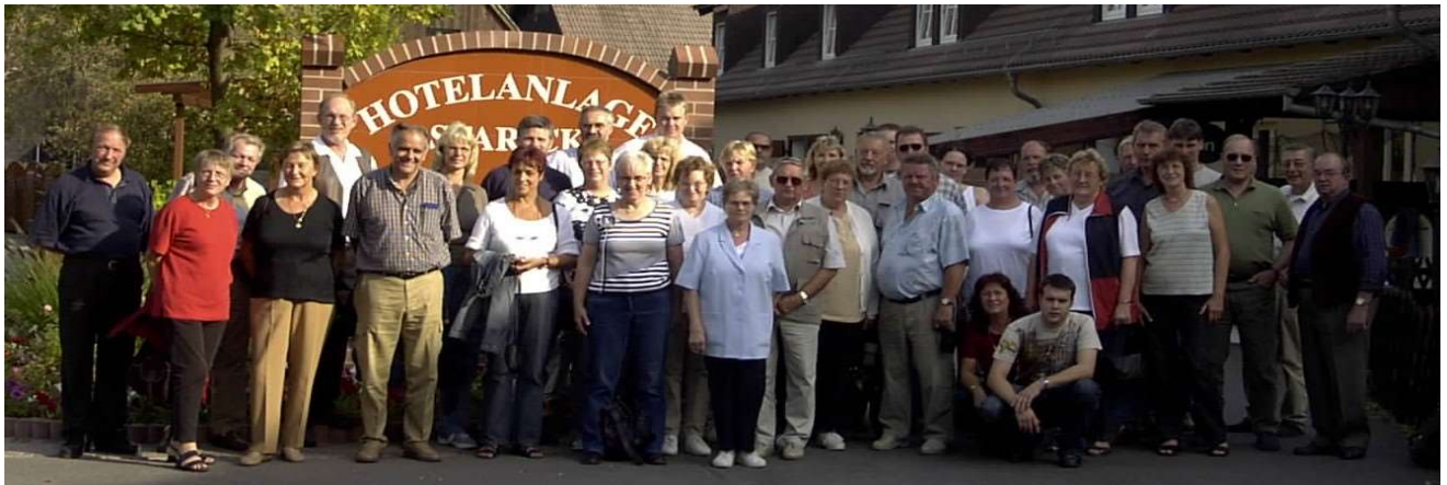
Ausflug zum Spreewald 2003