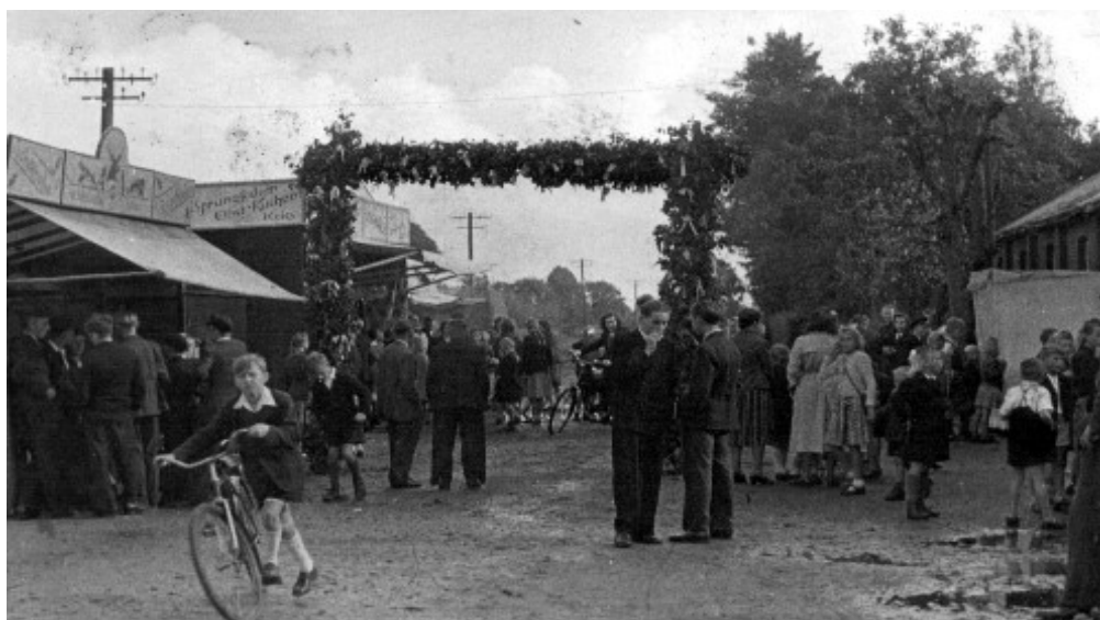
Festplatz bei Priet in den Fünfzigern