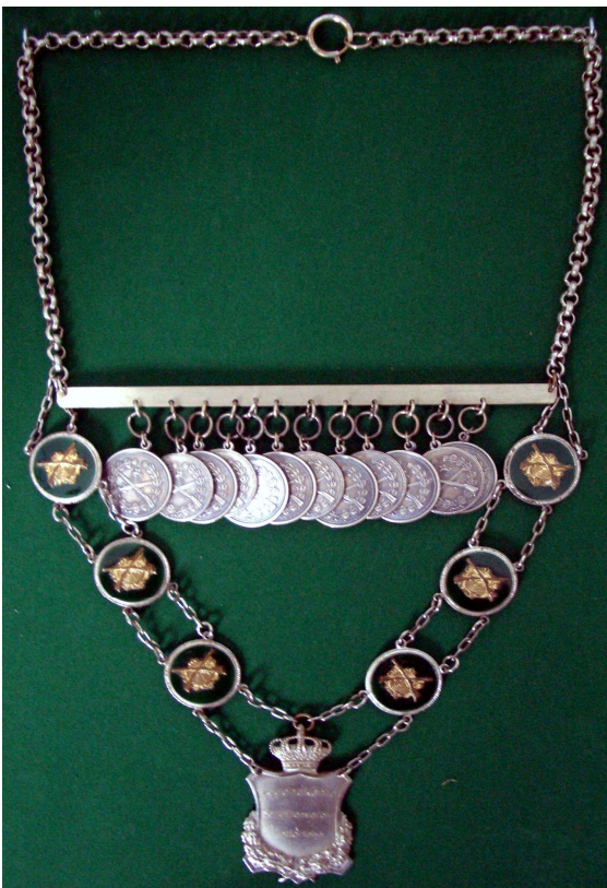
Jugendkönigskette von 1987 bis 2004