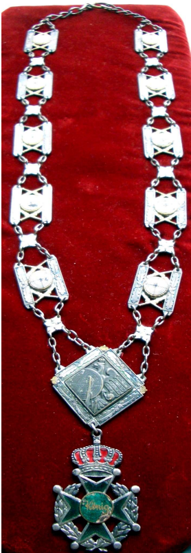
Königskette von 1975 bis 1984