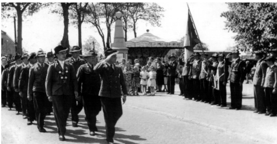
Schützenfest in Holte 1954