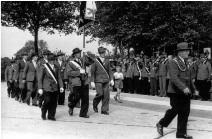
Kreisschützenfest 1956 in Marienheil