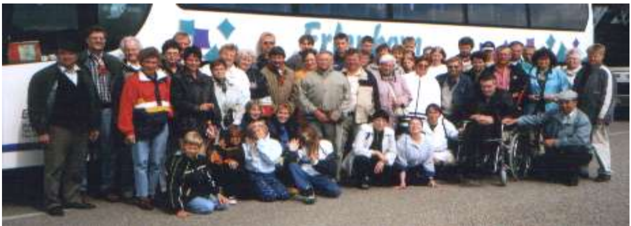
Ausflug nach Holland zum Zuiderseemuseum