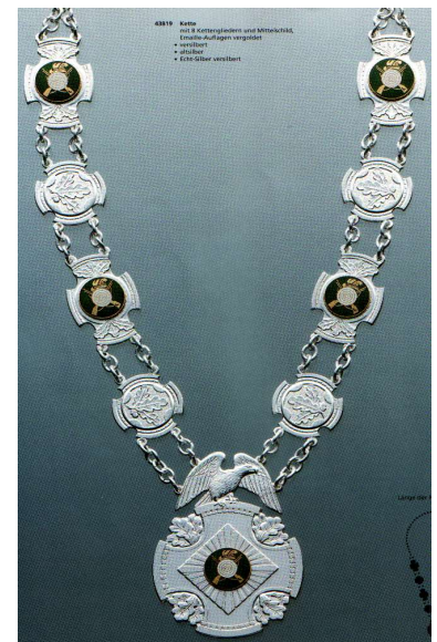
Jugendkönigskette ab 2005