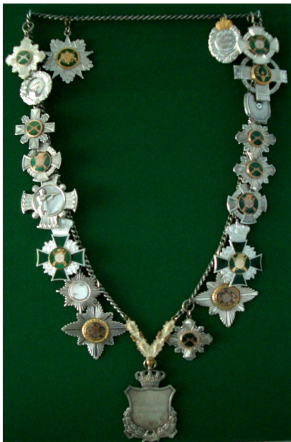
Jugendkönigskette von 1967 bis 1986

Zum Sommerfest sollen noch mehr Fahnen und Masten angeschafft werden, damit in der 1.Ostwieke und Schulstraße auch Fahnen aufgestellt werden können. Bei Sterbefällen von Vereinsmitgliedern soll am Beerdigungstag Halbmast geflaggt werden. Wie in anderen Vereinen bereits geschehen, können sich auch Damen dem Verein anschließen. Auf Anregung einiger Mitglieder sollen Ärmelabzeichen mit dem Emblem der alten Schule aus Holtermoor/fehn angeschafft werden.