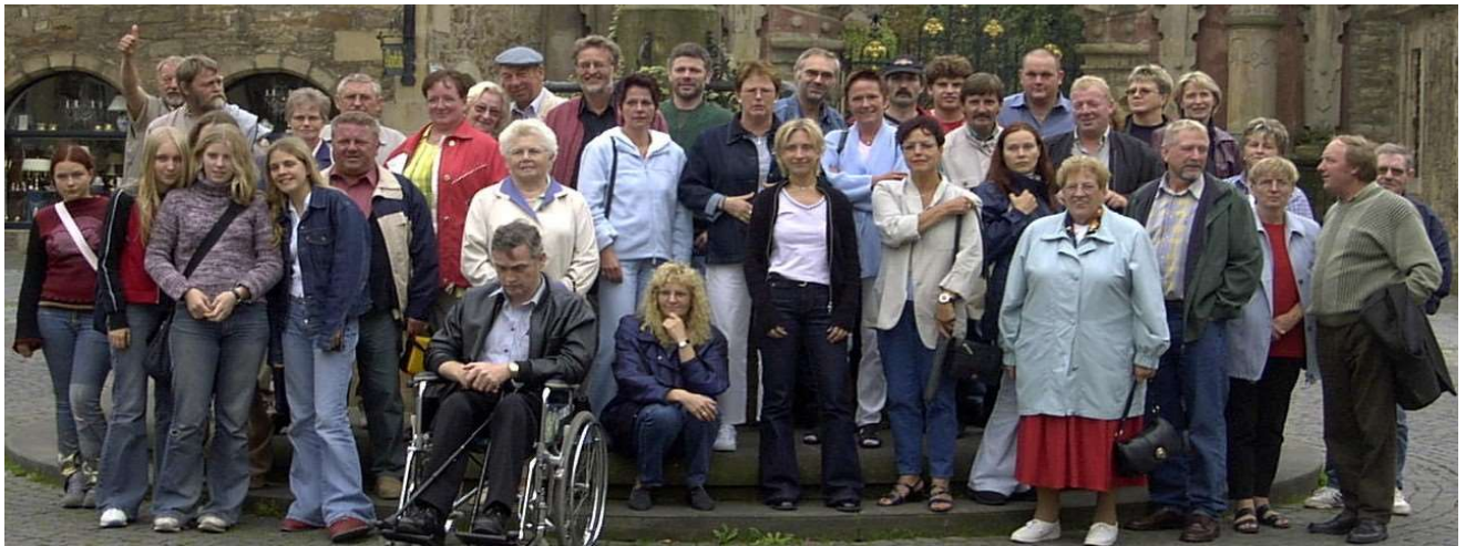
Ausflug nach Minden u. Bückebug